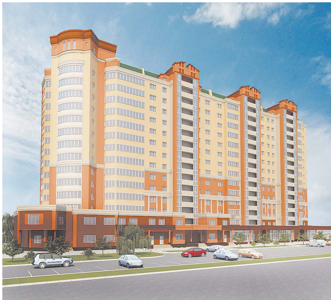
Непроданной в «Новых Черемушках» осталась только ваша квартира

«Новые Черемушки» привлекают уже своим расположением — в центре Иванова, рядом со школой, детскими сада-